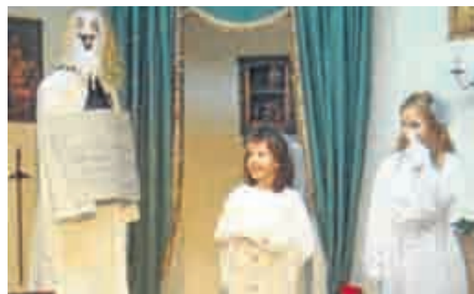
Das Schlossgespenst spukte in Moorenweis.