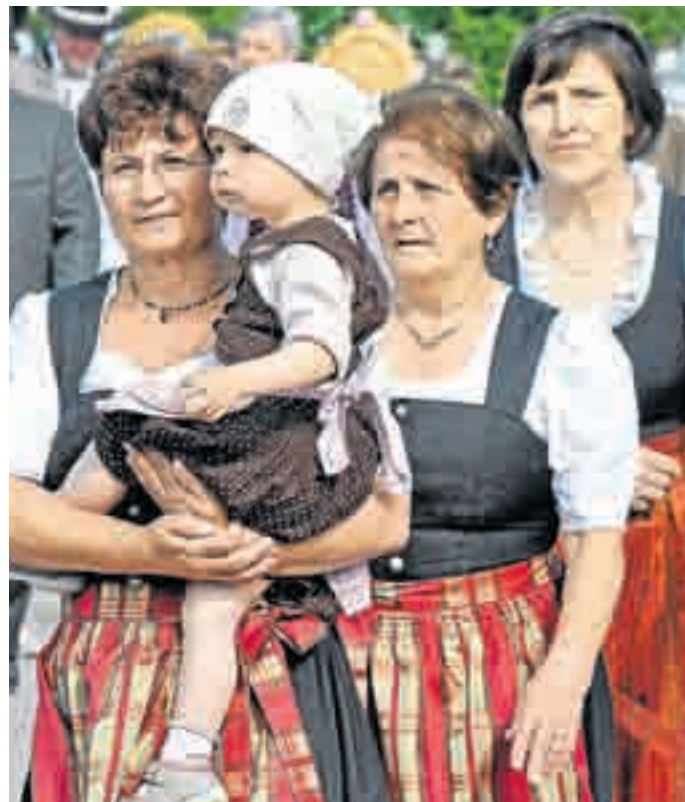
Auch die Kleinen staunten über die Trachten-Pracht.

Anschließend fand die Siegerehrung des Jubiläumsschießens statt. Diese wurde mit den Vereinen Dünzelbach, Moorenweis, Steinbach, Nassenhausen und Grunertshofen an fünf Schießabenden ausgetragen. Es beteiligten sich 85 Schützen, die besten 50 erhielten einen Preis vom reichhaltigen Gabentisch. Der Abend wurde stimmungsvoll von der Blaskapelle Adelshofen untermalt.