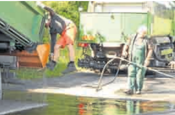
Sanierungsbedürftig sind die Gemeindestraßen.