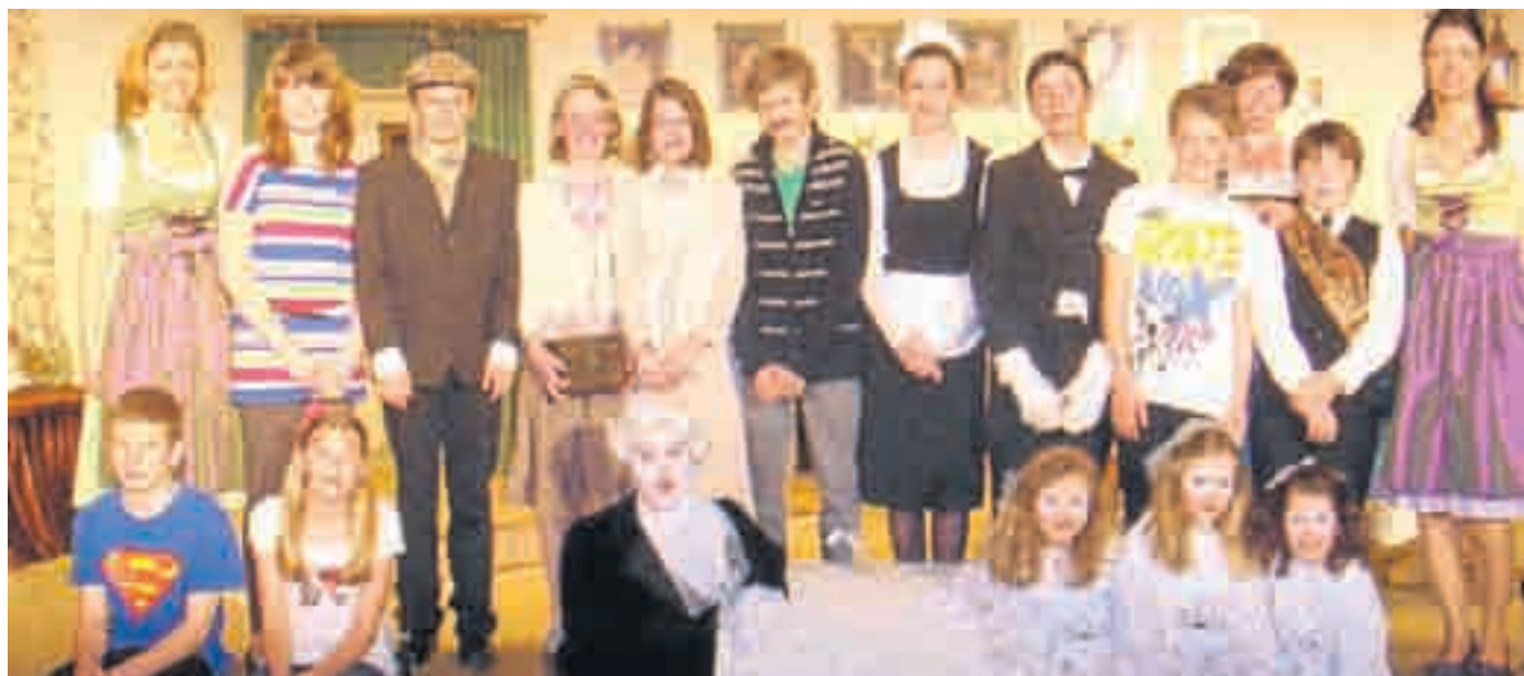
Das Ensemble der Moori Theater Kids begeisterte die Zuschauer.