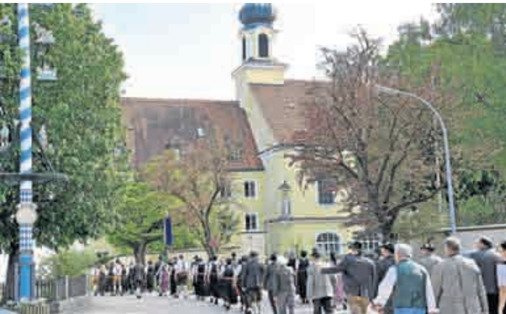
Zu hunderten pilgerten die Gäste zur Jubiläumsfeier des Schützenvereins.