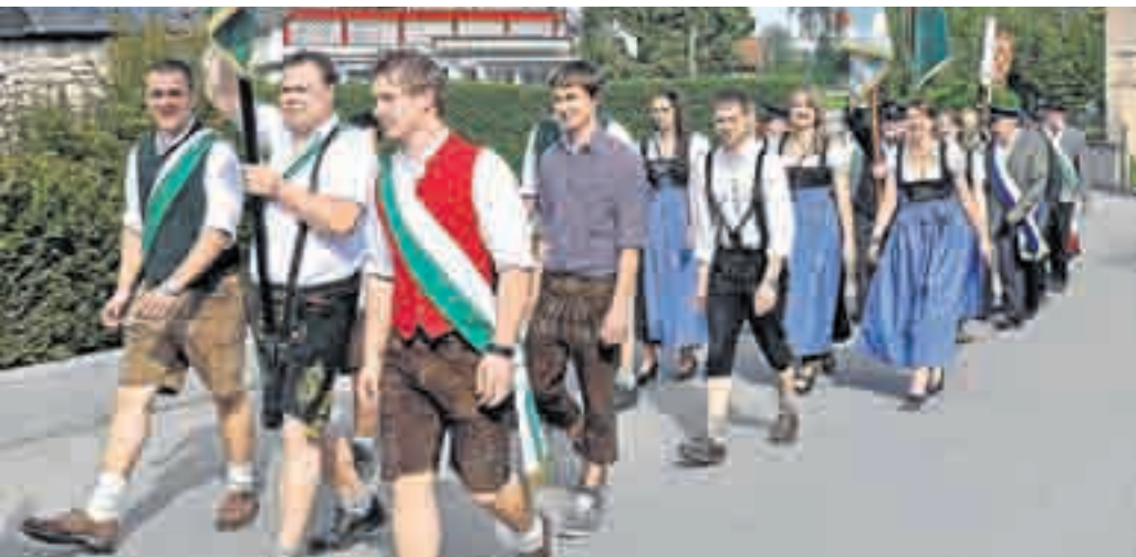
Mit einem großen Festzug feierten die Schützen und ihre Gäste.