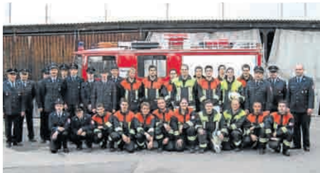
Für den Ernstfall gerüstet: Die Floriansjünger absolvierten ihre Leistungsprüfung.